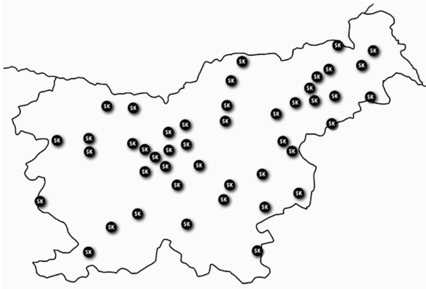
Sl. 2. Raspored mašinskih prstenova u Sloveniji [36]

U 2007. godini u Sloveniji je funkcionisalo 45 mašinskih prstenova koji pokrivaju teritoriju cele Slovenije. Oni imaju 5.755 članova, što čini 7% svih poljoprivrednika Slovenije. Mašinski prstenovi su u 2007. godini obradili površinu ukupno 61.112 ha, uloživši 137.295 časova rada mašina. [36]