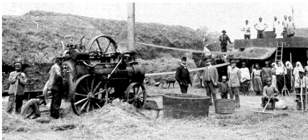
Sl. 1. Žetva i vršidba žita (IX vek)

Arsenović i Krstić (2002) ističu da se pod uticajem povećanja stepena opremljenosti poljoprivrednog gazdinstva sredstvima mehanizacije, ispoljava porast dohotka. Porast se odvija do tačke 27,22 kW/ha oranične površine, nakon čega dohodak počinje da opada. Međutim, sadašnja (mala) veličina seljačkih gazdinstava u Srbiji predstavlja prepreku za povećanje stepena opremljenosti sredstvima mehanizacije jer onemogućava potpuno korišćenje mašina.