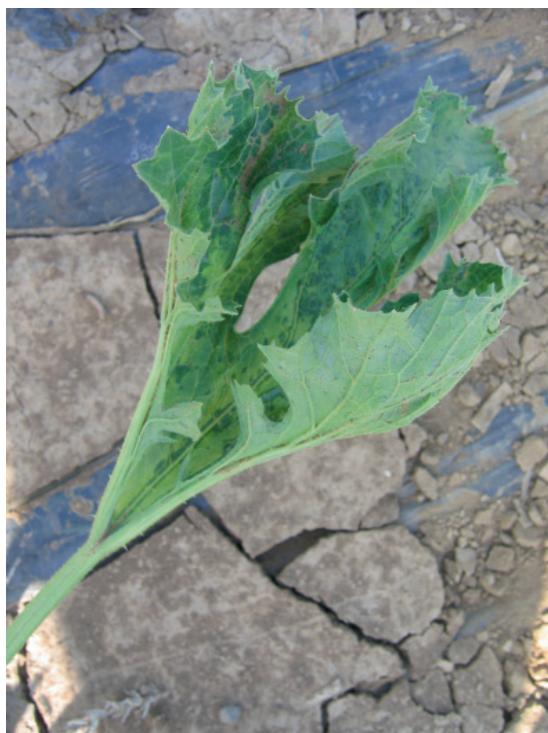
Slika 3. Mešana infekcija CMV i WMV: uvijanje liske na gore na C. pepo 'Tosca'