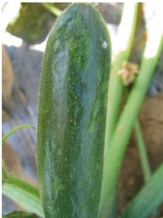
Slika 4. Mešana infekcija CMV i WMV: promena boje ploda i bradavičavost na C. pepo 'Tosca'