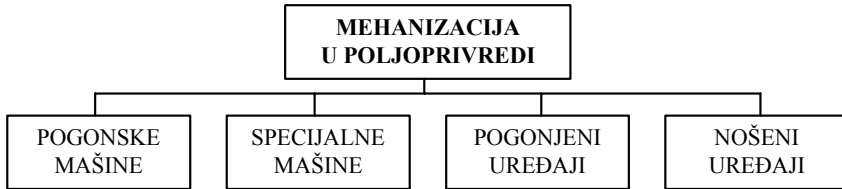
Šema 1. Oprema za mehanizaciju u poljoprivredi

Oprema za mehanizaciju u poljoprivredi može se podeliti uslovno na četiri grupe, kao što je prikazano na šemi 1.