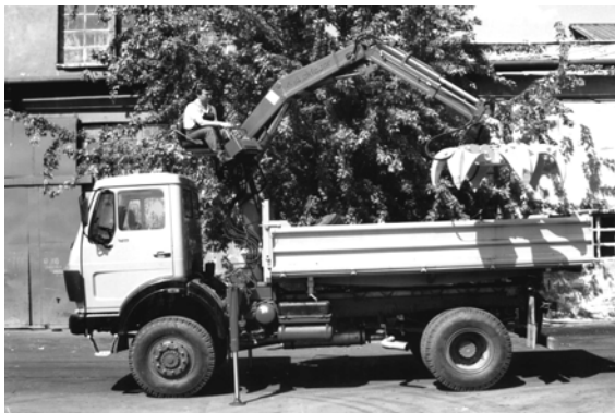
Slika 4. Kamionska dizalica KD u radu

Na slici 4. prikazana su kamionska dizalica u radu.