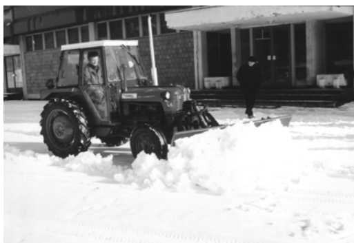
Slika 3. Odrivna daska OD-3

Odrivna daska tipa OD-3 lako se montira na traktore snage 22-24 kW. Odrivna daska (slika 3) predstavlja veoma koristan priključni uređaj koji ima široku primenu u građevinarstvu i poljoprivredi. Prvenstveno je namenjena za planiranje, rasturanje i prikupljanje rasutih materijala. U zimskom periodu može se koristiti za čišćenje snega na putu, u manjem obimu. Odrivna daska sa radnim cilindrom, razvodnikom i slavinom, povezana je sa traktorskom hidraulikom i u sprezi sa traktorom omogućava izvršavanje poslova za koje je namenjena. Osnovni tehnički podaci dati su u tabeli 8.