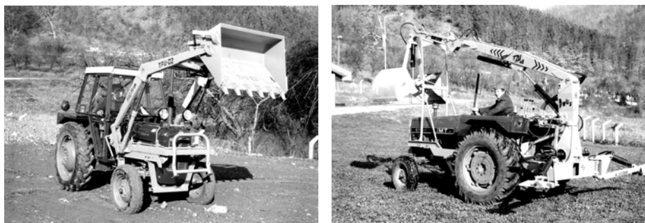
Slika 2. Traktorski uređaji tipa TPU i TZU

U cilju povećanja iskorišćenja raspoloživih pogonskih mašina, traktora i mehanizaciju radova u poljoprivredi, razvijen je i čitav niz takozvanih traktorskih uređaja pod zajedničkim nazivom "RASINA". Na slici 2 prikazani su traktorski uređaji TPU i TZU.