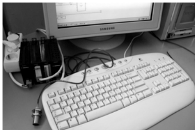
Sl. 1. Uređaji korišćeni pri programiranju

Signal o brzini mašine vodi se u programabilni logički kontroler (PLC) koji se sastoji od četiri modula. Važno je napomenuti da se PLC korišćen za programiranje hardverski razlikuje od onoga koji se realno može koristiti u praksi, ali da je programiranje izvršeno prema realnim uslovima (slika 1).