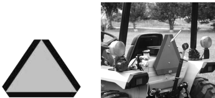
Sl. 1, 2. Znak koji označava sporohodno vozilo [16]

Praktična primena ovog znaka je upozorenje za ostale učesnike u saobraćaju, da se ispred njih nalazi sporohodno vozilo i da treba smanjiti brzinu kretanja i pažljivo prići tom vozilu, zbog narednih operacija koje slede (preticanje, obilaženje, mimoilaženje).