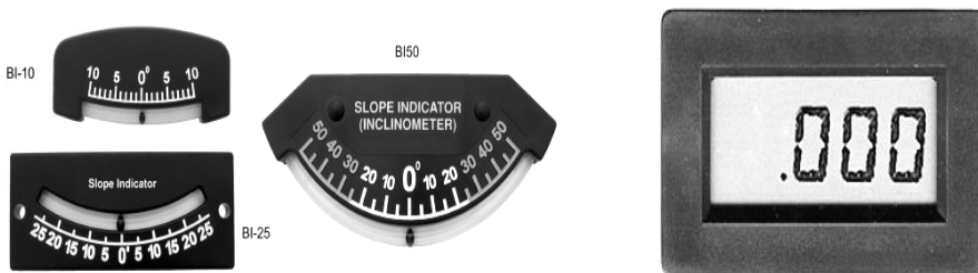
Sl. 7, 8. Razni tipovi inklinometra

Deo opreme koja upozorava rukovaoca na opasne situacije na terenima sa većim nagibima su indikatori nagiba terena (inklinometri) [2], [27]. Danas postoje razne tipovi (Sl. 7, 8) indikatora nagiba terena ili alarma koji daju važne informacije rukovaocu traktora u vezi stabilnosti traktora. Prikazani instrumenti mogu biti, od osnovnih sa kazaljkom do digitalnih LCD ekrana sa daljinskim upravljanjem. Većina modela pored vizuelnog pokazivanja nagiba traktora imaju ugrađen i alarmni uređaj koji se aktivira kada traktor dostigne opasnu tačku naginjanja pre momenta prevrtanja. Pored ovog načina upozorenja rukovaoca, deo modela inklinometara povezani su sa pogonskim delom traktora i pri postizanju opasnog ugla naginjanja, zaustavlja se rad traktora i mašina se bezbedno zaustavlja.