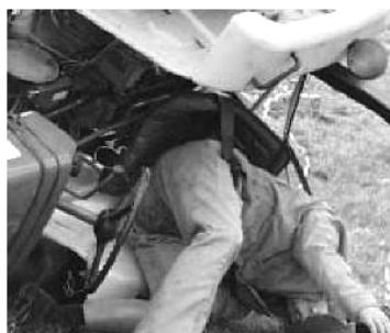
Sl. 5, 6. Sigurnosni kaiševi za vezivanje rukovaoca za osnovi sedišta traktora [25]

Treba ipak napomenuti, da i danas u Republici Makedoniji pored mnogobrojnih nesreća, firme koje prodaju nove traktore (jer zakon to ne sprečava), nude razne tipove i modele traktora koje nemaju zaštitne ramove ili kabine i sigurnosnih kaiševa.