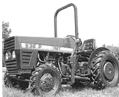
Sl. 3, 4. Kabina i zaštitni ram na traktorima za povećanje bezbednosti u radu [20]

Istraživanja za dugi vremenski period, a posebno od 1999 do 2003 godine u Republici Makedoniji, pokazala su, da pri prevrtanju traktora tragične posledice pri radu sa traktorom u poljoprivrednim uslovima iznose 77,27%. Upotreba kabina ili zaštitnog rama u kombinaciji sa sigurnosnih kaiševa (Sl. 5, 6) do 95%, sigurno povećavaju šanse učesnika pri prevrtanje traktora, da prežive i prođu sa manjim povredama je konstatacija mnogih autora [16], [22], [23], [24], [25].