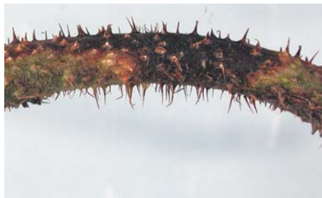
Slika 13. Simptomi antraknoze na listu (levo) izdanku kupine (desno)