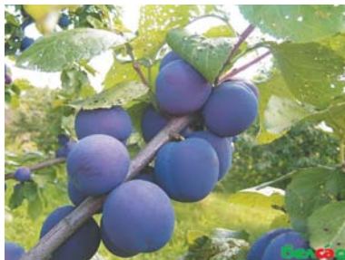
Slika 4. Simptomi šupljikavosti lista kod šljive