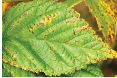
Slika 12. Simptomi pegavosti lišća na listu kupine

Ukoliko se pojavi primenjuju se isti preparati kao kod didimele.