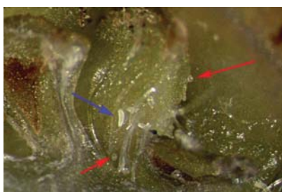
Slika 21. Simptom krupne grinje na kupini