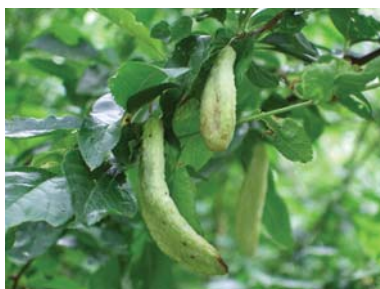
Slika 7. Simptomi rogača kod šljive

U suzbijanju ove bolesti efikasne su neke preventivne mere. Sve zaražene plodove potrebno je skupiti i zakopati ili zapaliti. Drugi zahvat koji treba koristiti je rezidba i uklanjanje zaraženih izdanaka. Pored ovih preventivnih mera potrebno je pred kretanja vegetacije koristiti sredstva za zaštitu bilja na bazi bakra.