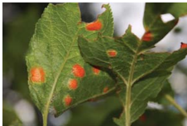
Slika 5. Simptomi narandžaste pegavosti lista kod šljive