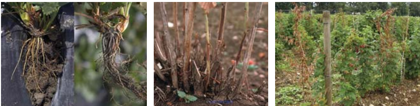
Slika 23. Trulež korena maline

Koristiti samo zdrav, sertifikovan, testiran sadni materijal. U toku zasnivanja zasada primeniti 60 l komposta po metru dužnom. Zasad ne zasnivati na zbijenim, vlažnim zemljištima. Ne zasnivati zasad na zemljištu na kome je konstatovana zaraza u narednih 15 godina. Ne vršiti razmenu opreme i mehanizacije sa farmerima u čijim zasadima ima simptoma ili je potvrđeno prisustvo bolesti. Tehnologija gajenja na „uzdignutim redovima“ omogućava prirodnu drenažu zemljišta oko zone korenovog sistema maline i predstavlja nepovoljne uslove za razvoj patogena. Navedena tehnologija je neizbežna na zbijenim zemljištima.