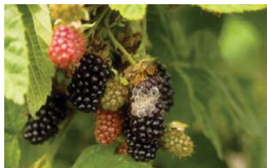
Slika 15. Simptomi truleži na plodovima kupine