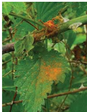
Slika 11. Simptomi narandžaste rđe na listu kupine

Rasprostranjena bolest najčešće napada krajem maja dvogodišnje izdanke a kasnije prelazi na lišće. U početku na naličju lista se vide narandžaste pege, koje kasnije potamne, kasnije se lišće savija prema unutra, deformiše, suši i opada. Na ovu bolest sorta Tornfri je relativno otporna. Preventivna mera zaštite je odstranjivanje izdanaka koji su doneli rod odmah nakon berbe. Protiv ove bolesti koristimo bakarne preparate (bordovska čorba).