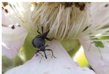
Slika 28. Cvetojed