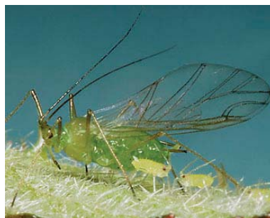
Slika 25. Amphorophora rubi