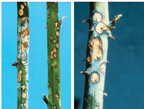
Slika 14. Simptomi pepelnice na izdanku kupine

Javlja se u vidu smeđih pega na izdancima. Preventivne mere su proređivanje izdanaka, pravilna rezidba radi bolje prozračivosti. Za ovu bolest koriste se sumporni preparati.