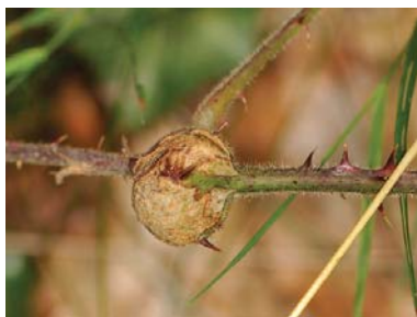
Slika 27. Simptomi napada malinine muve galice

Pregledati mlade izdanke nakon berbe i odstraniti sve koji imaju gale. Gale zbog larvi koje se u njima nalaze treba spaliti.