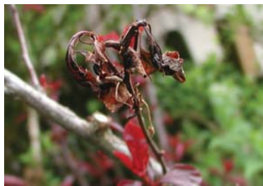
Slika 3. Simptomi Monilia sp. na plodu (levo) i listovima (desno) kod šljive