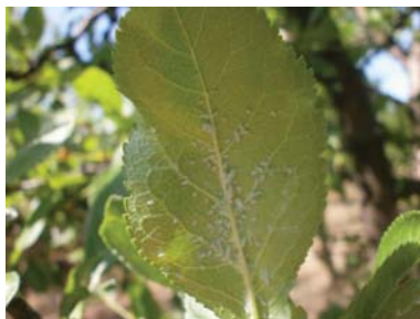
Slika 8. Zelena šljivina vaš - Hyalopterus pruni

Sve vrste voćaka, pa tako i šljiva, ugrožene su raznim vrstama lisnih vaši. Lisne vaši hrane se sišući biljne sokove što uzrokuje kovrdžanje lišća i izobličavanje plodova, ali značajne štete, kao što smo spomenuli, nastaju prenošenjem virusnih bolesti (šarka šljive), i izlučivanjem medne rose koju naseljavaju gljive čađavice. Lisne vaši se zadržavaju na naličju lista, dok neke napadaju i vrhove izdanka. Većina vrsta menja domaćina. Prezime u stadijumu jaja na voćki ili žbunu, gde štetu pravi prva generacija, a zatim se krilata generacija seli na drugog domaćina iste vrste ili odlazi na zeljaste biljke. Vrlo brzo razvijaju rezistentnost na insecticide. Zimska jaja lisnih vaši suzbijamo tretiranjem pre kretanja vegetacije, a u toku vegetacije vaši suzbijamo u početku jače pojave. Od preparata dozvoljenih u ekološkom uzgoju možemo koristiti Neem ulje ili Pyretrum.