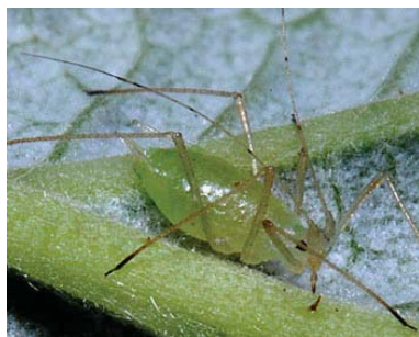
Slika 25. Amphorophora idaei