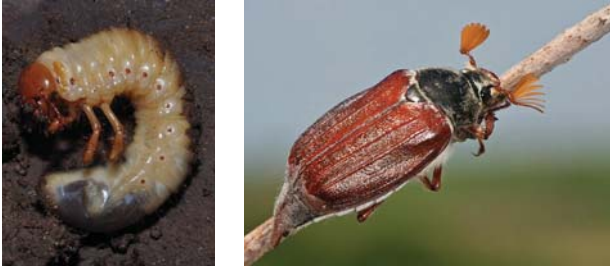
Slika 19. Veliki majski gundelj

Larve ovoga insekta nanose štete korenu i izazivaju sušenje grmova. Preveniva je da kupinjak ne sadimo u blizini šume i da je higijena zemljišta zadovoljavajuća.