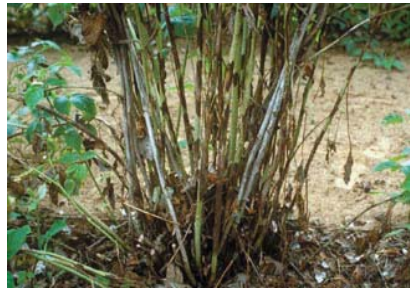
Slika 24. Didymella applanata kod maline