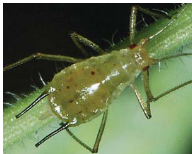
Slika 20. Lisne vaši na kupini gornje dve slike - Macrosiphum funestum ; donje dve slike - Sitobion fragariae .