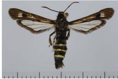
Slika 17. Staklokrilac

Gusenice ovog insekta bužše izdanke i uvlače se u srž od korena biljke do njenog vrha i tako izazivaju uvenuće i uginuće biljke. Preventiva je da se odmah posle berbe odstrane i spale izdanci koji su doneli rod.