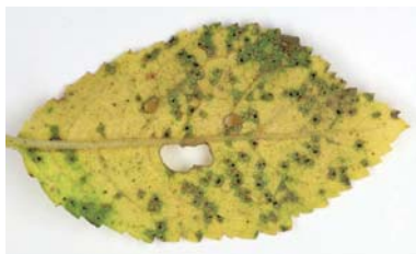
Slika 6. Simptomi rđe lista kod šljive

Paleta preparata za suzbijanje rđe u organskom voćarstvu znatno je suženo samom činjenicom da bakarni preparati kod veće broja sorti šljive mogu uzrokovati fitotoksičnost. Zavisno od vremenskih prilika tokom tretiranja može doći do pojave paleži šupljikavosti liske. Od preparata dozvoljenih u ekološkom voćarstvu može se tokom juna i jula koristiti fungicide Myco-Sin u koncentraciji od 0,8 do 1%, svakih 7 do 14 dana zavisno od vremenskih prilika i uslovima za razvoj bolesti.