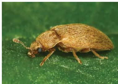
Slika 16. Imago malinine bube

Izbegavati podizanje zasada maline u neposrednoj blizini šuma. Gajenjem dvorodnih sorti i berbom u jesenjem periodu izbegava se napad štetočine koji je u tom periodu daleko niži. Postaviti bele kopke od momenta početka cvetanja i pratiti prvu pojavu imaga malinine bube. Nakon pojave prvih imaga u malinjak postaviti po jednu lepljivu klopku (celu ili jednu polovinu) na svakih 5 dužnih metara reda, što predstavlja način smanjenja brojnosti ove štetočine. Takođe, suzbija se u početku cvetanja ukoliko