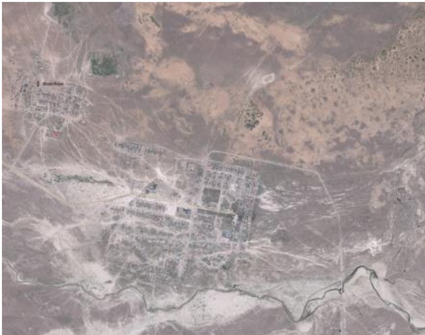
Slika 1. Satelitski snimak analiziranog rejona Karatobe, Zapadno Kazahstanske oblasti Figure 1. Satellite image of the analyzed regions Karatobe, Western Kazakhstan area

U radu je načinjena kosmokarta pomenutog poligona uz pomoć programa GlobalMapper . Koordinate poligona su 49^{\circ}41'02'' severne geografske širine i 53^{\circ}32'33'' istočne geografske dužine (Sl. 1).