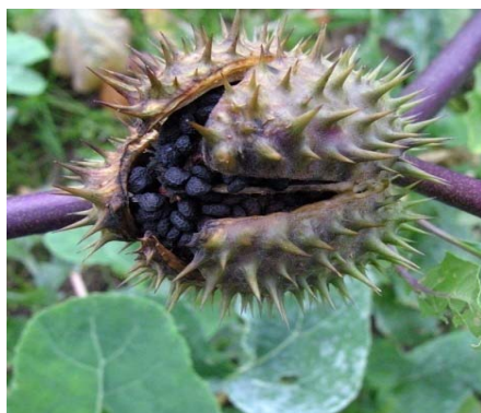
Slika 3 Plod Datura stramonium Picture 4 Fruit of Datura stramonium