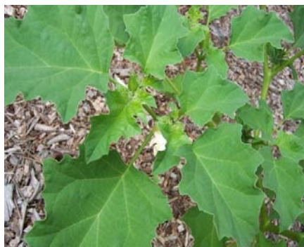
Slika 1 List Datura stramonium Picture 1 Leaf of Datura stramonium