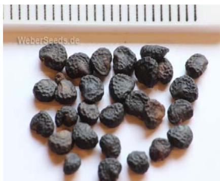
Slika 4 Seme Datura stramonium Picture 4 Seed of Datura stramonium

Tatula je jednogodišnja zeljasta biljka, terofit (T 4 ). Razmnožava se semenom, proizvodi do 20000, maksimalno 45500 semena po biljci. Kasnoprolećna vrsta, klija i niče IV-X meseca, pri minimalnoj temperaturi od 10-12 °C, optimalno na 24-28 °C, jesenje biljke ne prezimljavaju. Seme očuva klijavost u zemljištu do 3.5 godine. Klija i niče na dubini manjoj od 10-12 cm. Cveta i plodonosi VI-X.