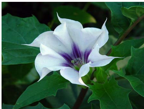
Slika 2 Cvet Datura stramonium Picture 2 Flower of Datura stramonium