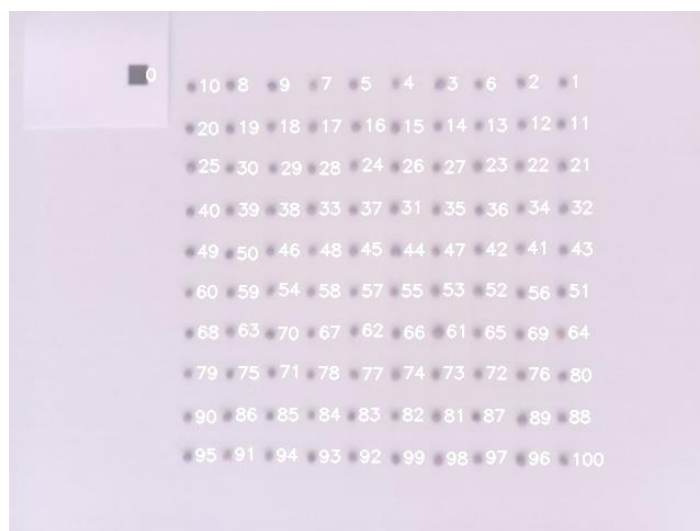
Slika 2. Numerisane semenke za koje se računa ekvivalentni dijametar

Obrada, odnosno analiza slike je jednostavna, brza i neinvanzivna metoda u merenju ekvivalentnog prečnika, površine i zapremine semena [12]. Digitalna analiza slike može se koristiti pored utvrđivanja procene kvaliteta uljane repice, uključujući određivanje geometrijskih karakteristika, boje, površine semena, takođe i za identifikaciju nečistoće koju je teško odvojiti u procesu čišćenja [13] i za brojanje semenki [12] ili praćenje klijanja semena. Prikaz jednog takvog sistema koji može da vrši uzorkovanje putem slike sa mesta merenja predstavljen je u radu [8].