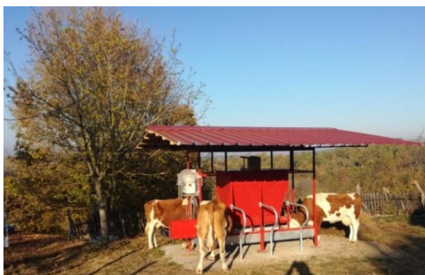
Slika 2. Automatski uređaj za prihranu domaćih i divljih životinja Figure 2. Automatic feeder for domestic and wildlife

Automatski uređaj za prihranu životinja je bio vrlo pouzdan u toku eksploatacije za vreme celog trajanja slobodnog tova krava i nije zabeležen nijedan kvar ni zastoje u radu. Takođe, uređaj je precizno vršio raspodelu hrane prema utvrđenim potrebama krava za prihranu u zavisnosti od raspoložive zelene mase travnjaka, vremena tova i telesne mase grla. U toku eksploatacije nije dolazilo do ispadanja i rasipanja hrane iz cilindričnog kućišta spiralnog transportera i korita hranilica. Pored toga, nije dolazilo do rasipanja hrane iz korita ni u toku konzumiranja hrane od strane krava.