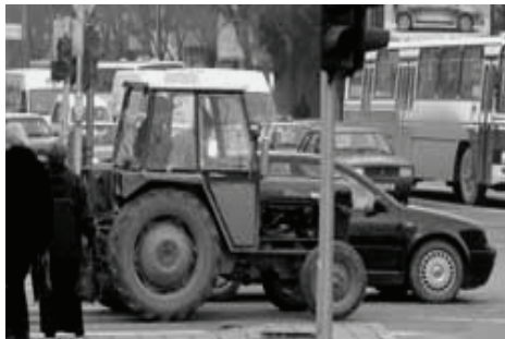
Sl. 1. Traktor u javnom saobraćaju, [6].

Upotreba tehnički neispravnih vozila (neosvetljene zaprege noću, neosvetljeni traktori sa neispravnim svetlosnim i signalnim uređajima, vrlo često neispravni uređaji za upravljanje i kočenje kod raznih vozila i slično) takođe doprinose povećanju broja nesreća a time i broj nastradalih osoba u ovim nesrećama na javnim putevima Makedonije (Sl.2).