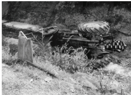
Sl. 2. Tragična posledica nesreća, [6].