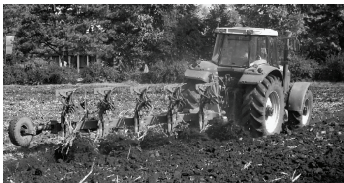
Sl.1. Traktor Massey-Ferguson 8160 u radni operacijama na poljima PKB-a