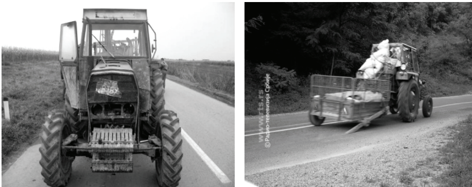
Sl. 2. Neispravni traktorski agregati u javnom saobraćaju Republike Srbije, [9], [36].

Analizom prikazanih podataka (Tabela 1., Grafik.1), dolazi se do zabrinjavajućih rezultata o broju nastradalih lica. Prema ovoj analizi u Republici Srbiji prosečno godišnje u saobraćajnim nezgodama koje su izazvali vozači traktora, tragično strada 62 osobe, teško povređenih bude u proseku 144, i lako potvrđene su 262 osobe.