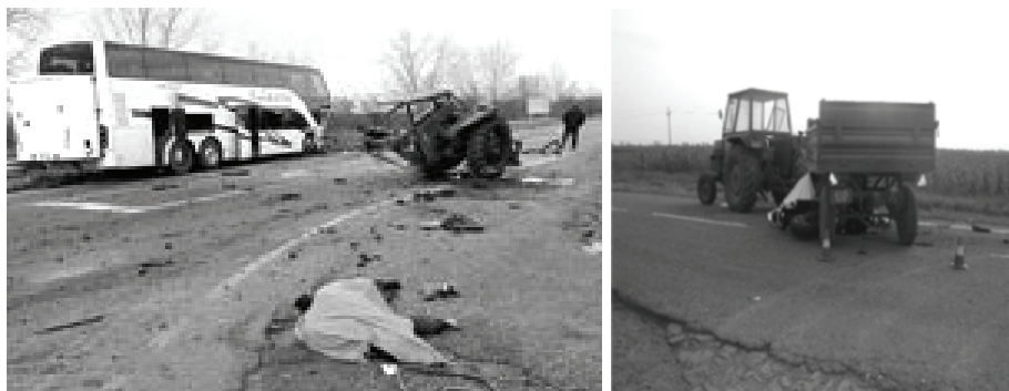
Sl..1. Nesreće sa traktorima i tragične posledice, [35.]

Prema podacima istraživanja [8], [9], [10], u Srbiji, u periodu od 1980. do 1988. godine, je poginulo u različitim nesrećama i mestima (kretanje traktora uz, niz, ili bočni nagib, nepravilna vuča neispravnih traktora, vožnja drugih lica u traktoru na mestima koja nemaju sedište, vožnja neprilagođenom brzinom, prevrtanja, i slično), gde je traktor učestvovao kao vučno-energetska jedinica, preko 900 traktorista, ili prosečno 112 godišnje. U direktnim nezgodama u javnom saobraćaju na teritoriji Srbije (bez pokrajina) od 1990 do 2000 godine, tragično je godišnje nastradalo u proseku 76 vozača traktora.